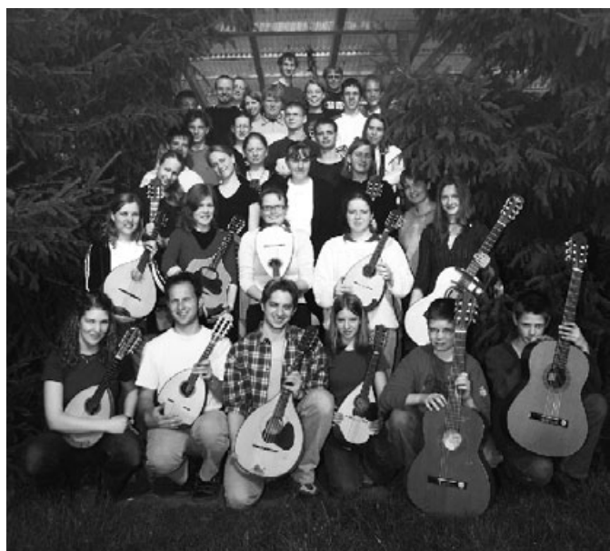
Jugendzupforchester Bra. - Berlin

Ein Bericht aus dem Publikationsorgan des BDZ "Concertino 3/2005"