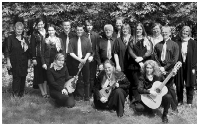
Wittener Mandolinen- und Gitarrenorchester

Ein Bericht aus dem Publikationsorgan des BDZ "Concertino 3/2005"